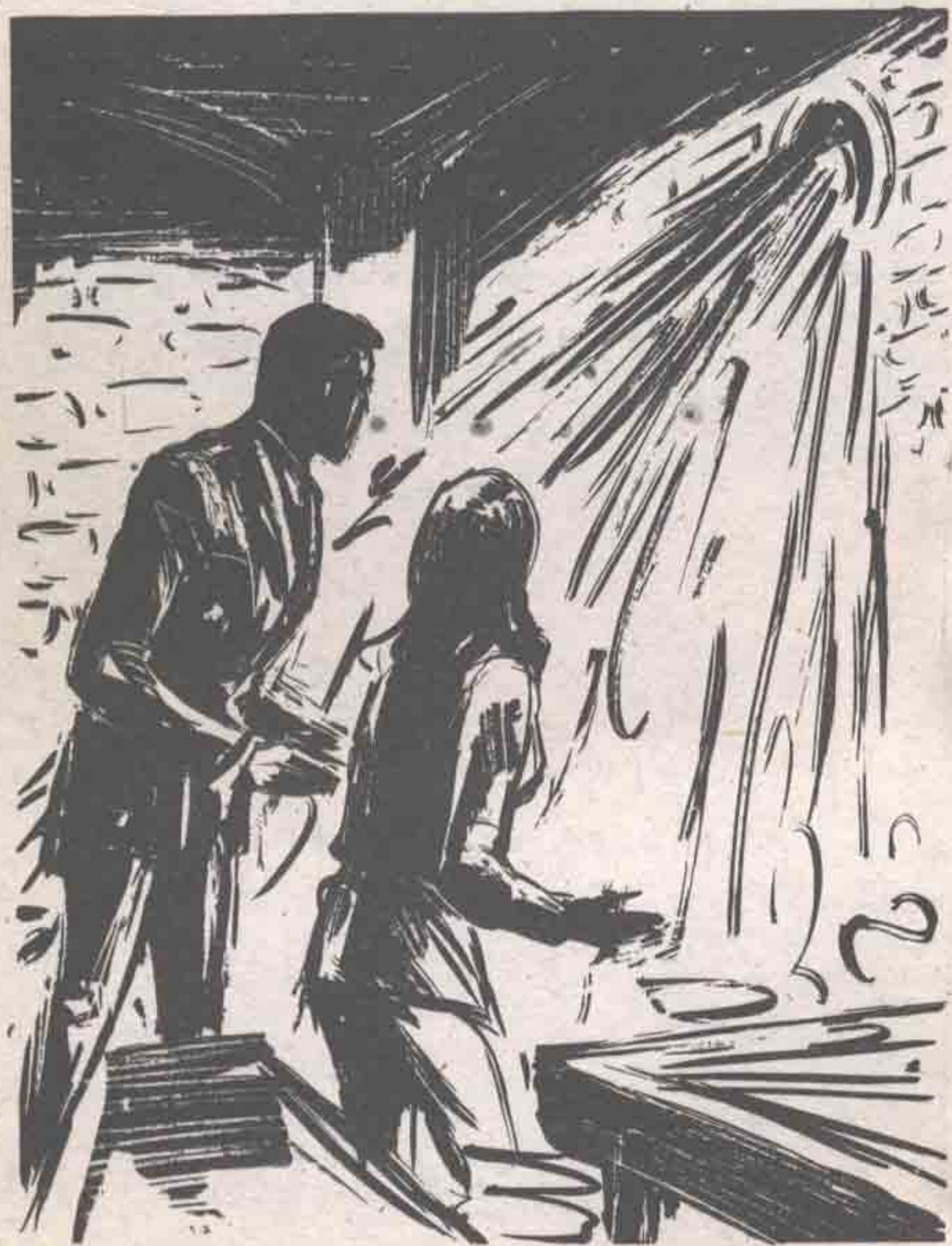
ورأيا الماء الغزير ، الذي ينهمر من فتحة التهوية ، إلى جوف القبو ..

— أظن هذا مستحيلاً هذه المرة يا ( أدهم ) .. لقد أصبحنا كالفئران في المصيدة .